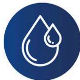
Disponibilidad De Agua De Nacimiento Natural Potabilizada